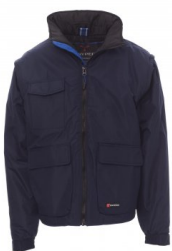
DRESS BLU NAVY/BLU ROYAL