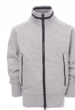
GRIGIO MELANGE/BLU NAVY